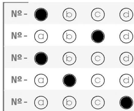
figura 01 - preenchimento CORRETO de cartão-resposta Ensino Fundamental